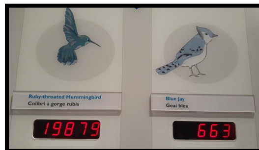
Un pèse-personne original

En terminant, voici la transcription de l'extrait d'une légende abénaquise, qui m'a ravi.