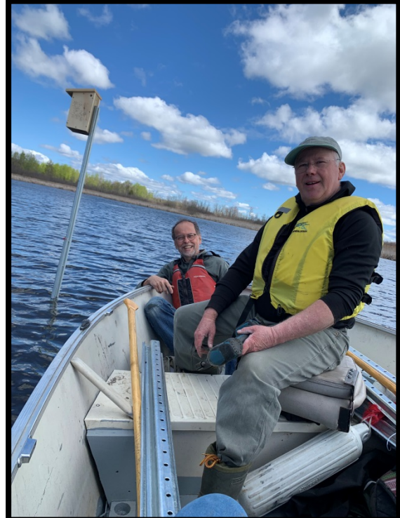
Des heures de plaisir à lutter contre les vagues

Finalement, en deux jours, l'opération fut réussie et les hirondelles ont adopté des nichoirs, dès la 1 re journée après leur mise en place. Nous sommes fiers de notre réussite et j'en suis quitte pour un bon mot de dos...après autant d'efforts. L'opération nettoyage des nichoirs est prévue l'hiver prochain...en raquettes sur le lac.