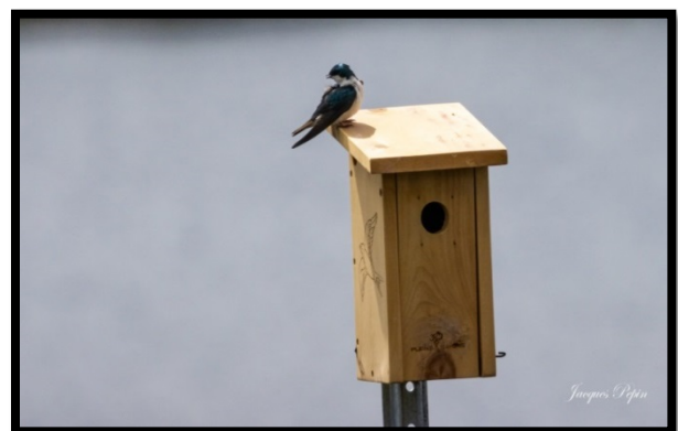
Hirondelle bicolor perchée