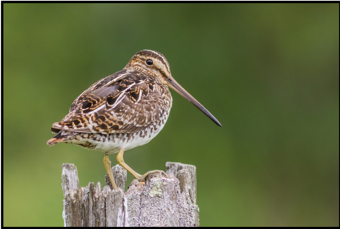
Bécassine de Wilson