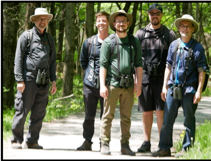
Équipe « Les Oies Zoo » de Granby

Le défi doit se tenir en mai pendant 24 heures au maximum. Il s'agit d'observer un maximum d'espèces d'oiseaux durant cette période. Les participants recueillent des dons pour des projets éducatifs ou de conservation de l'avifaune. Deux équipes ont sillonné la Haute-Yamaska et une s'est limitée au territoire du Parc national de la Yamaska.