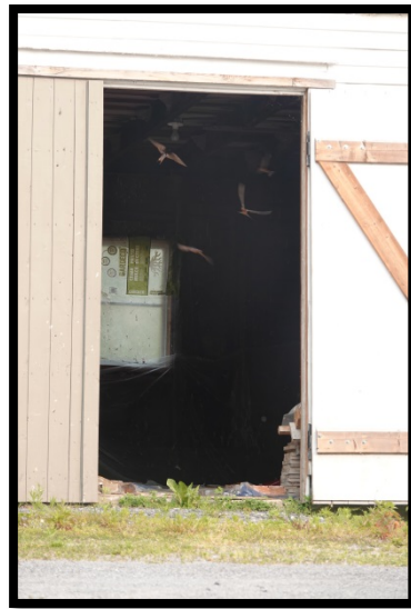
La grange pleine de vie

« Chez nous, il est interdit d'entrer dans cet immense couvoir pendant l'été. Ces magnifiques oiseaux sont de grands défenseurs de leur habitat, et pas n'importe qui peut y entrer. Ils sont propriétaires des lieux de fin avril à fin août. »