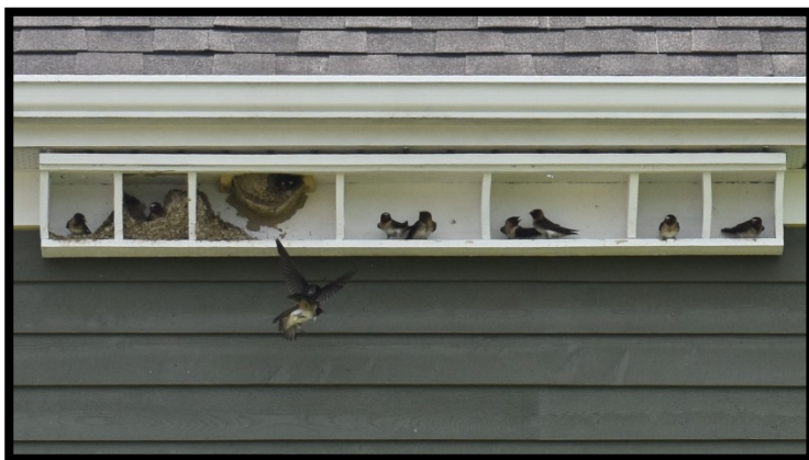
Nichoir horizontal avec séparateurs installés sous les corniches

Lorsqu'ils ont constaté le problème, Colleen et Matthieu se sont dépêchés d'installer un nichoir horizontal avec séparateurs sous les corniches à l'arrière de la maison et Colleen s'est mise à fouiller l'Internet pour apprendre comment fabriquer des bases de nid pour rendre les compartiments attractifs aux hirondelles.