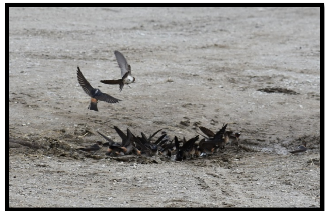
Hirondelles allant chercher de la boue pour faire leur nid