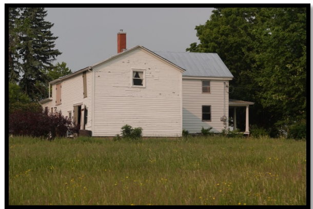
Au cœur de Pike River, le long de la rivière aux Brochets

L'Hirondelle rustique est l'un des oiseaux les plus répandus au monde. Elle niche dans tous les provinces et territoires du Canada, à l'exception du Nunavut. Sa caractéristique la plus remarquable est son vol acrobatique, qui lui permet de poursuivre ses proies dans les habitats ouverts, y compris des prairies et des étendues d'eau. On la reconnaît par son ventre orange, son dos bleu et sa queue profondément fourchue. Au Canada, l'Hirondelle rustique est considérée comme une espèce menacée et des stratégies de rétablissement sont en cours pour assurer la survie de l'espèce.