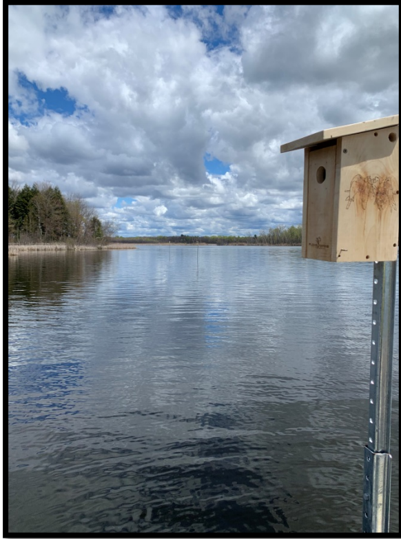
Un nichoir nouvellement installé

Nous avons sué un bon coup puisque l'opération s'est révélée être beaucoup plus complexe que prévu. À partir d'une grosse chaloupe à fond plat, prêtée gracieusement par l'OBV Yamaska, il fallait tenir une tige métallique bien droite et l'enfoncer dans le fond du marais, avec un lourd butoir. Par la suite, il fallait visser une 2 e tige comportant un nichoir, à la 1 re tige déjà enfoncée dans la vase.