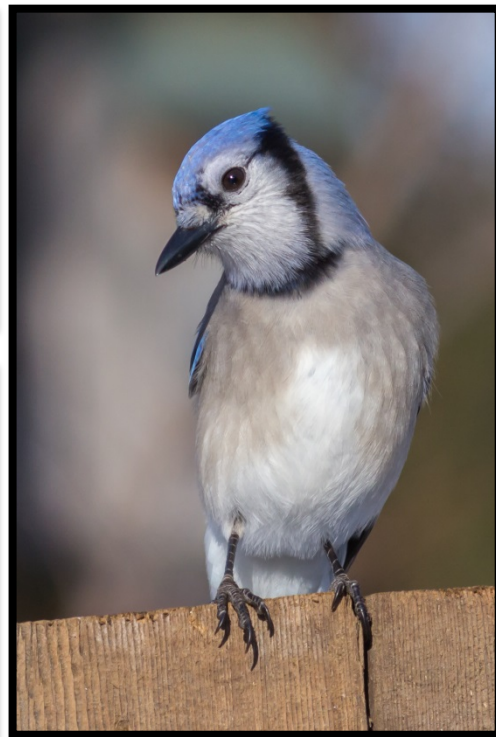
Oiseaux dont le chant peut être entendu dans le film « Paul à Québec »