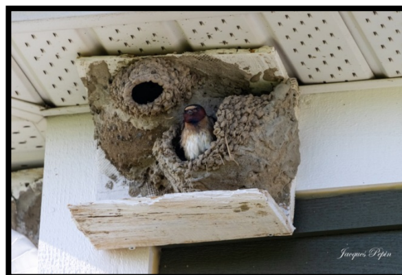
Hirondelle à front blanc au nid