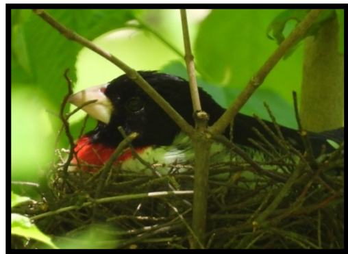
Cardinal à poitrine rose sur son nid